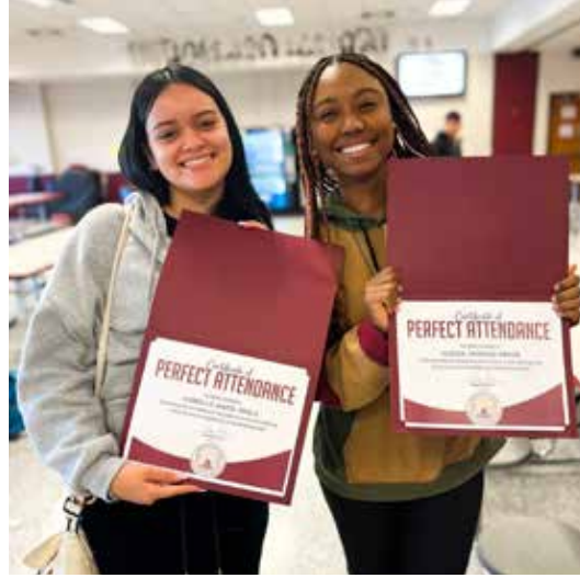
أحتفل أكثر من ٤٠٠ طالب من طلاب مدرسة نيو بريتن الثانوية بالحضور المثالي

تم مؤخراً تكريم أكثر من ٤٠٠ طالب من طلاب مدرسة نيو بريتن الثانوية لحضورهم المثالي خلال الربع الأول. نعم لقد قرأت ذلك بشكل صحيح - ٤٠٠ طالب!! لتكريم هذا الإنجاز الرائع، استضافت مدرسة نيو بريتن الثانوية حفل إفطار خاص لهؤلاء الطلاب المتفانين. إن التزامهم بالحضور والمشاركة في تعليمهم أمر يستحق الثناء حقاً ونحن فخورون بهم جداً.