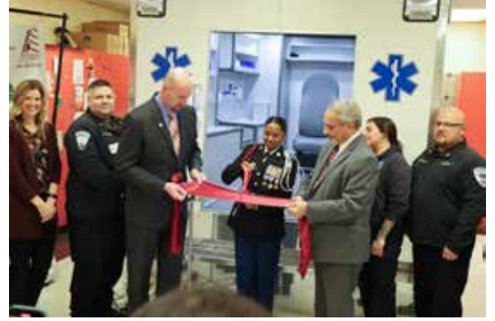
تم الكشف عن جهاز سيارة الإسعاف الصناعية في مدرسة نيو بريتن الثانوية

كشفت مدارس منطقة نيو بريتن مؤخراً عن جهاز سيارة إسعاف اصطناعية جديد في مدرسة نيو بريتن الثانوية مع حفل رسمي لقص الشريط للاحتفال بالفرص الجديدة العديدة المتاحة للطلاب من خلال البرنامج.