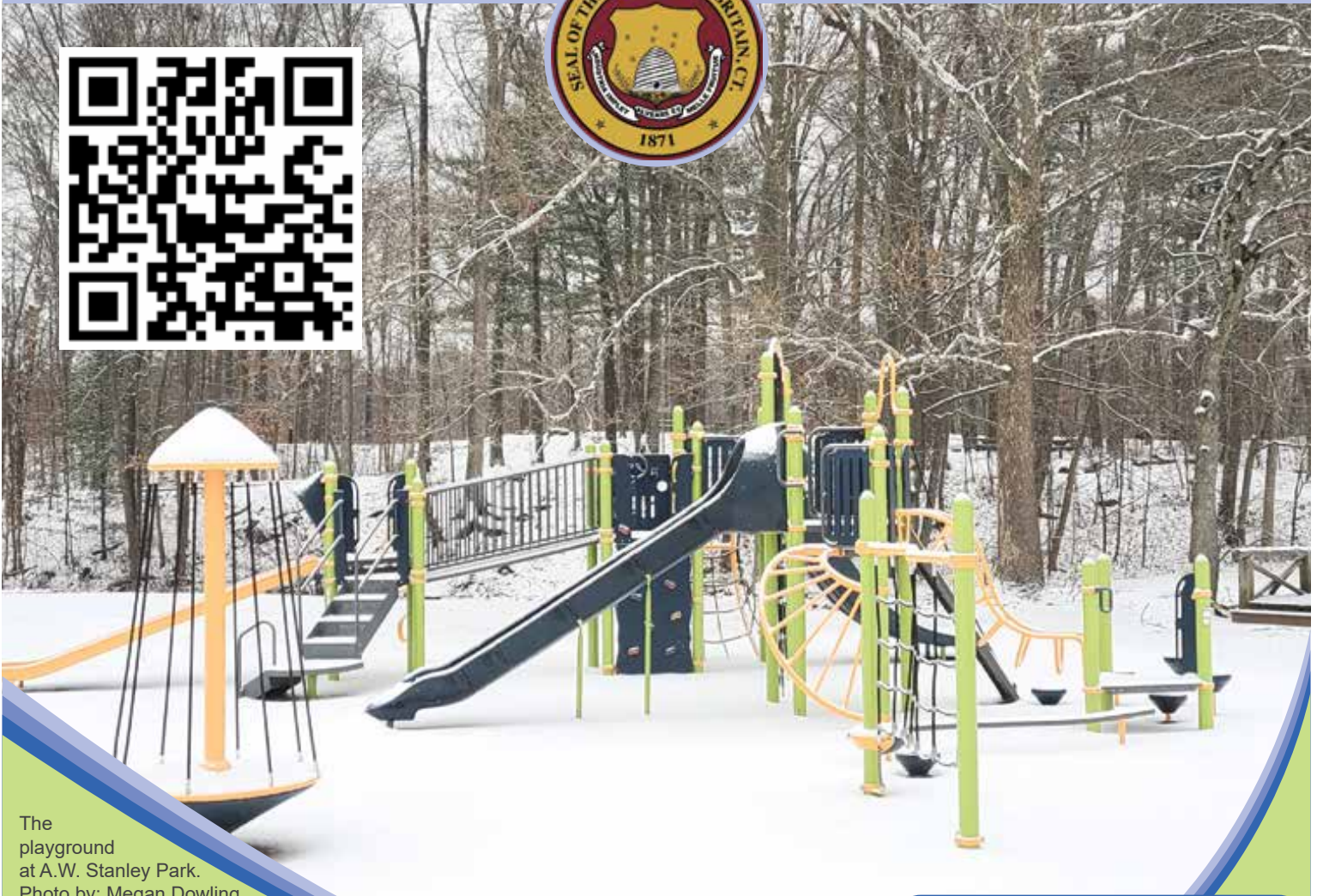
The playground at A.W. Stanley Park.