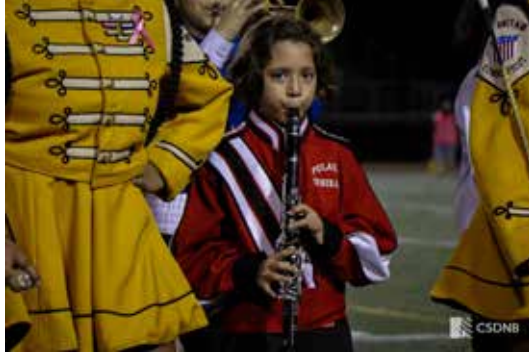
تستضيف فرقة جولدن هراكين (Golden Hurricanes) ليلة فرقة المدارس المتوسطة

ما الجديد وماذا يحدث في مدارس منطقة نيو بريتن الموحدة؟