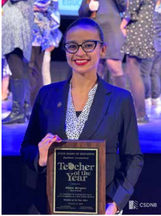
تكريم معلمة العام المثالية في مدارس منطقة نيو بريتن في فعالية على مستوى الولاية

ما الجديد وماذا يحدث في مدارس منطقة نيو بريتن الموحدة؟