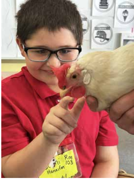
صف في مدرسة سميث يرد الجميل أثناء التعلم

ما الجديد وماذا يحدث في مدارس منطقة نيو بريتن الموحدة؟