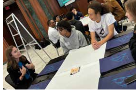
طلاب مدرسة نيو بريتن الثانوية يشاركون في تحدي الابتكار

تفتخر مدرسة نيو بريتن الثانوية في فصل الاقتصاد بالمشاركة في تحدي الابتكار لأكثر من يوم التابع لـ Sustainable Futures & Junior Achievement's Tech العالمية. تم إنشاء البرنامج من خلال شراكة مع منظمة الشباب العالمية Junior Achievement وشركة الاستشارات وخدمات التكنولوجيا Capgemini و مجلة The Hartford لتوفير فرصة فريدة للتعلم التعاوني الذي يركز على التكنولوجيا والاستمرار وبناء خطة عمل ومنتج يهدف إلى خلق عالم أكثر استمرارية. يتم توجيه الطلاب من خلال هذه التجربة العميقة التي تستغرق عدة أسابيع من قبل متطوعين محترفين يكرسون حياتهم المهنية لمثل هذه المواضيع. ستتاح للطلاب الفرصة لعرض أفكارهم أمام لجنة من الحكام والفوز بالجوائز. بالإضافة إلى ذلك سوف تتم دعوة الفرق الحاصلة على أعلى الدرجات للمشاركة في تحدي الابتكار على مستوى الولاية في نهاية العام!