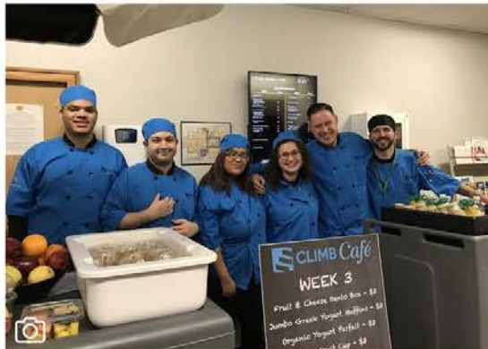
طلاب مدرسة CLIMB يقدمون القهوة والإفطار من مقهى CLIMB في مركز البلدية.

عربة طعام مدرسة CLIMB: عادت عربة طعام مدرسة CLIMB بالتعاون مع شركة الطعام Whitsons ومركز البلدية City Hall، سيقوم طلاب مدرسة CLIMB في نيو بريتن بتقديم القهوة وإفطار لموظفي مركز البلدية وموظفي إدارة مجلس التعليم من الساعة 9 صباحاً وحتى 11 صباحاً يوم 7 أكتوبر.