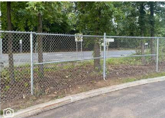
قبل وبعد: إصلاح السياج و إزالة الأعشاب الغير مرغوب فيها في مدرسة جافني الابتدائية (Gaffney Elementary School).