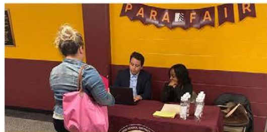
الموظفين يرحبون بمقدم طلب وظيفة مساعد التعليم في معرض فرص العمل الذي عقد في 24 سبتمبر.

نواصل العمل لتوظيف المساعدين التعليميين (Para-educators). حيث استضاف القسم يوم السبت الموافق 24 سبتمبر، معرض فرص العمل لتوظيف المساعدين التعليميين.