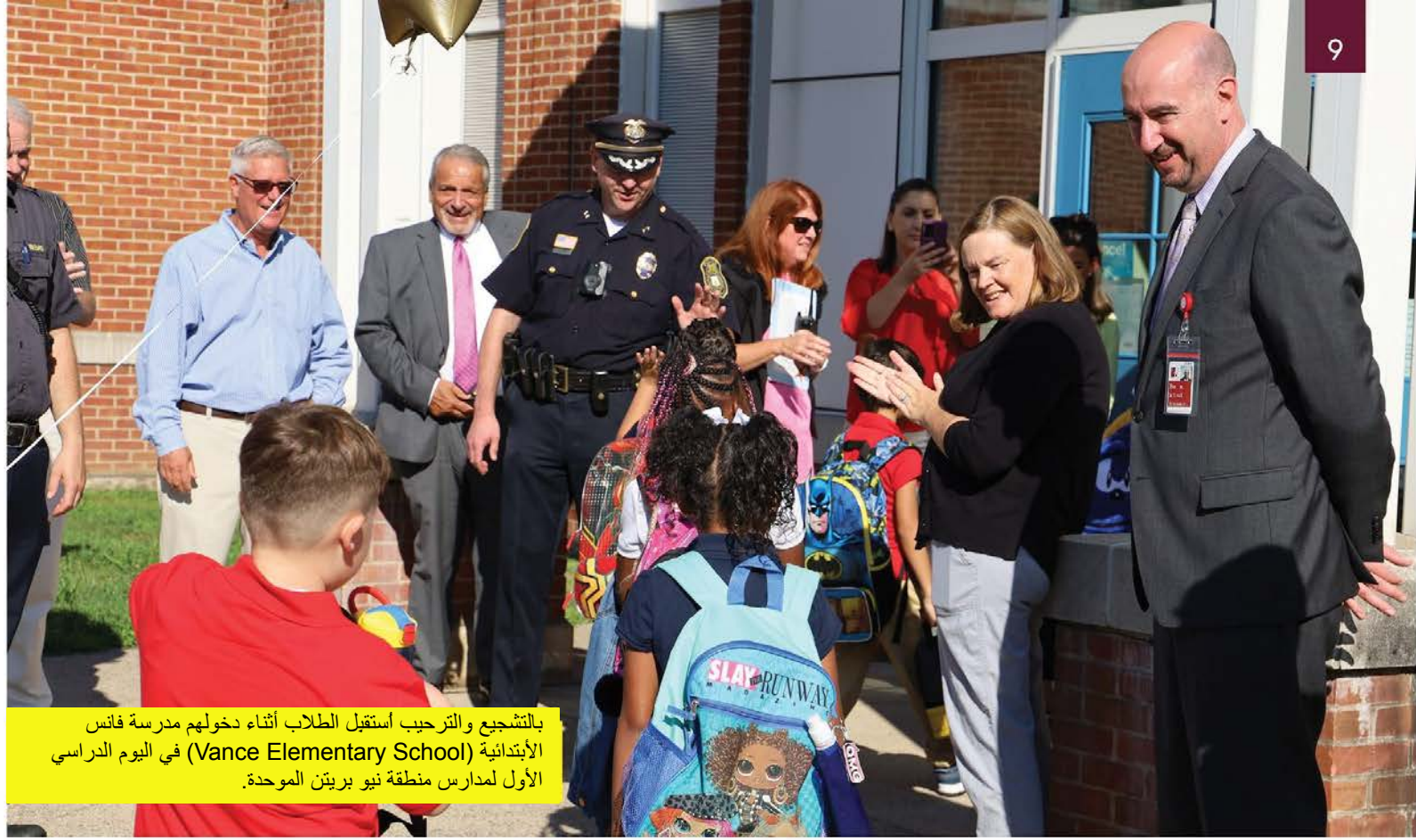
بالتشجيع والترحيب استقبل الطلاب أثناء دخولهم مدرسة فانس الابتدائية (Vance Elementary School) في اليوم الدراسي الأول لمدارس منطقة نيو بريتن الموحدة.