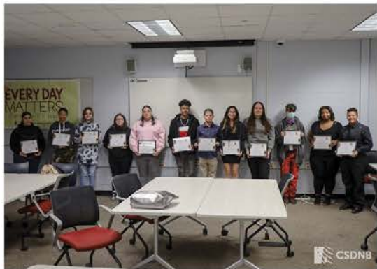
Foto de Grupo Estudiantil de NBHS del Trimestre

New Britain High School estuvo feliz de celebrar a 16 estudiantes sobresalientes el viernes en su Desayuno Estudiantil del Trimestre. Los estudiantes y sus familias se unieron a nosotros para un delicioso desayuno, atendido por nuestro equipo culinario ProStart, que fue seguido por la presentación de los premios. Los estudiantes fueron seleccionados para este premio por diferentes departamentos en el edificio por su perseverancia, duro trabajo, y el impacto positivo general en nuestra comunidad escolar. ¡Un gran agradecimiento a nuestras familias por apoyar a estos estudiantes en su éxito!