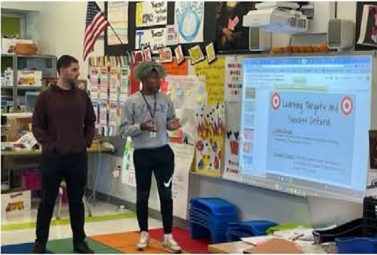
Profesores STEAM de CSDNB Perfeccionar sus habilidades de codificación:

¡Con estas habilidades a partir de la escuela elemental y llevándolas a lo largo de la escuela intermedia, no podemos esperar a ver lo que nuestros estudiantes crean en el momento en que están codificando en la Academia MET de NBHS!