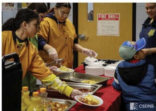
Equipo Culinario ProStart sirve el desayuno a Estudiantes del Trimestre de NBHS y sus familias